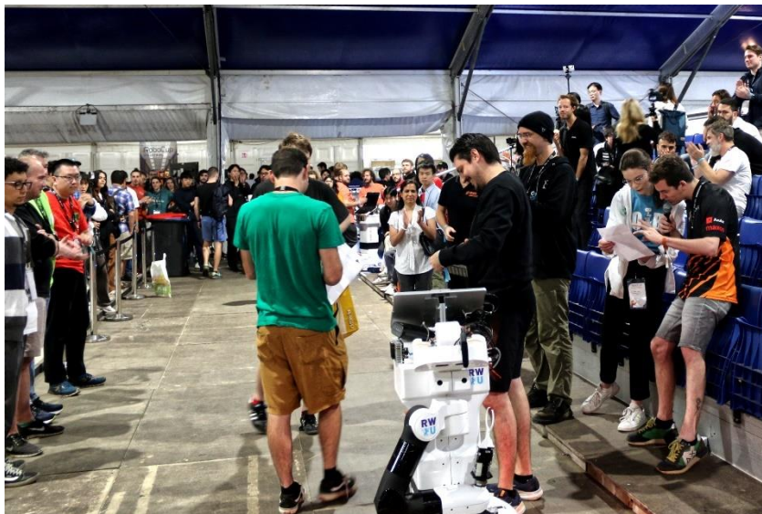
RWU-Roboter während der Challenge „Carry my luggage“.