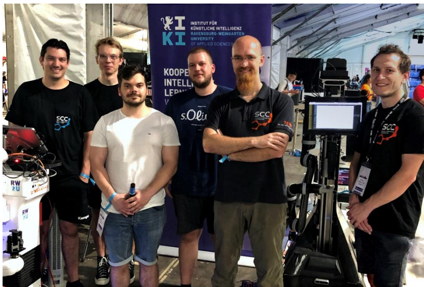
RoboCup-Teamfoto der RWU 2024.